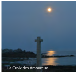
La Croix des Amoureux