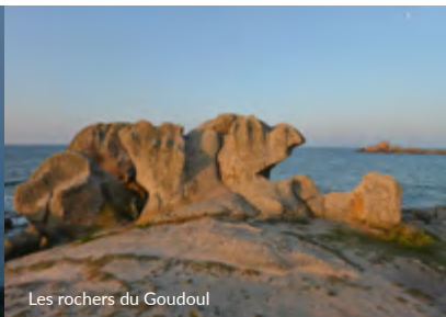
Les rochers du Goudoul