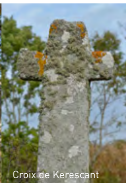
Croix de Kerescant