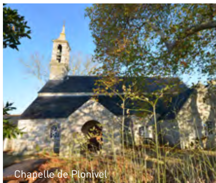
Chapelle de Plonivel