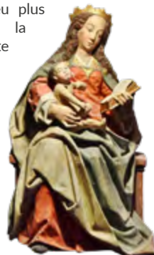
Vierge à l'Enfant lisant (Début du XVIe siècle)

9 Juste avant d'arriver à la chapelle tourner à gauche. Un peu plus loin, sur votre gauche, la fontaine. Continuer la route et emprunter le chemin ombragé qui ramène au bord du Ster. Reprendre à gauche et retour au parking.