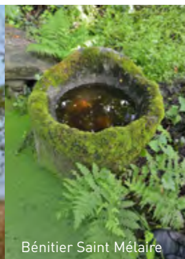
Bénitier Saint Mélaire

1 Parking : panneaux de l'exposition. Prendre le bord du Ster pour remonter la ria (au fond, sur l'autre rive, entre les arbres, le manoir de Kerlut).