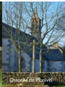
Chapelle de Plonivel

① Départ : panneaux de l'exposition. A droite des panneaux, se diriger vers la route et tourner à gauche direction Kervadol, Kervignon.