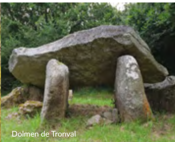
Dolmen de Tronval