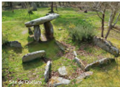
Site de Quélarn