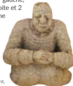
Support en encorbellement, église de Plobannalec

5 Faire demi-tour et rejoindre la Place du 19 mars 1962 par le chemin inverse.